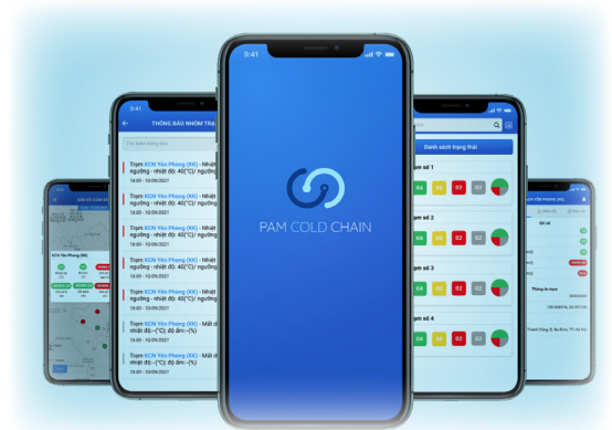
Ứng dụng di động