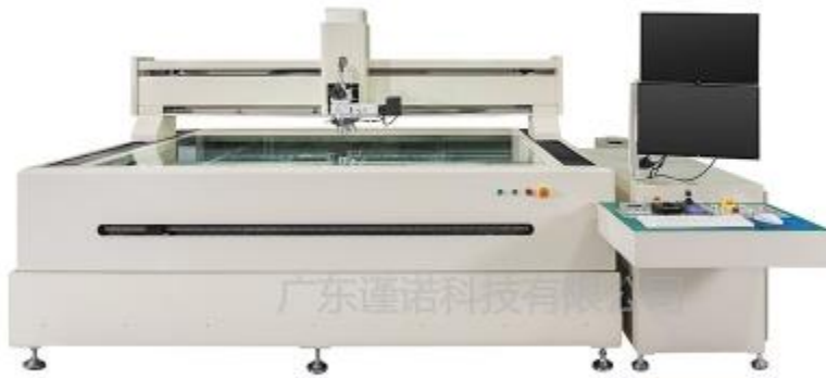
Automatic tool metallographic measuring instrument V2000