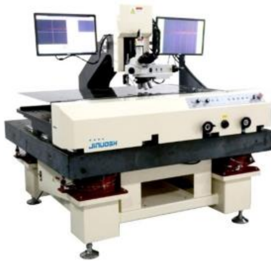
Automatic tool metallographic measuring instrument V400