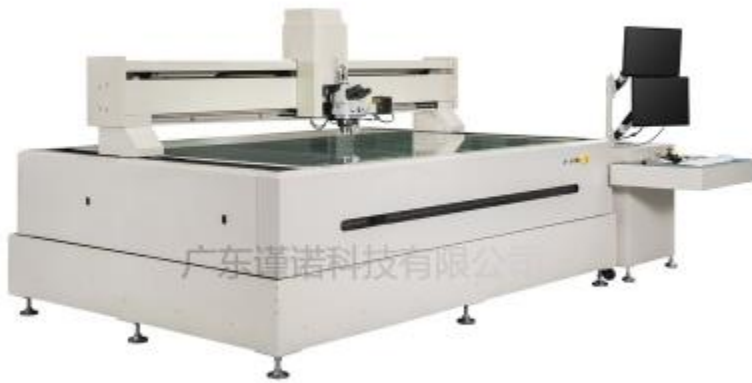
Automatic tool metallographic measuring instrument V800